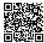
講座申込システム

申込受付期間：4月1日（月）から15日（月）まで 結果通知：4月19日（金）予定