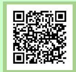
講座申込システム QRコード