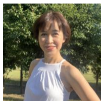
船津丸（ふなつまる） セントラルスポーツ所属IR