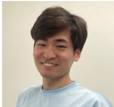
吉川(よしかわ) セントラルスポーツ所属IR